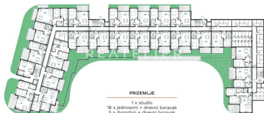
PRIZEMLJE 1 x studio 18 x jednosni + dnevni boravak 5 x dvosobni + dnevni boravak 43 spremišta