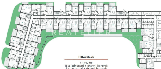
PRIZEMLJE 1 x studio 18 x jednosni + dnevni boravak 5 x dvosobni + dnevni boravak 43 spremista