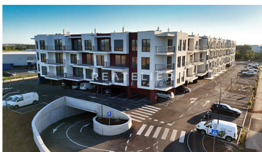
PRIZEMLJE natkriveni i vanjski parkirni prostor