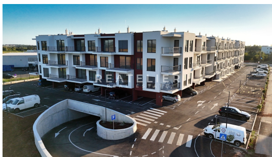
PRIZEMLJE natkriveni i vanjski parkirni prostor