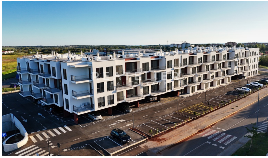
GARAŽA - garažna parkirna mjesta i spremišta