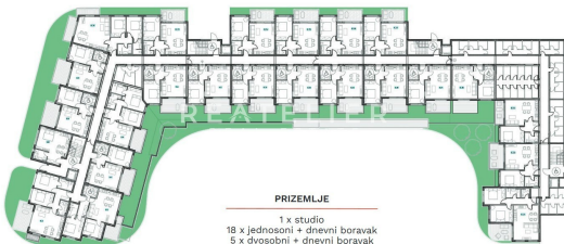
PRIZEMLJE 1 x studio 18 x jednosobni + dnevni boravak 5 x dvosobni + dnevni boravak 43 spremišta