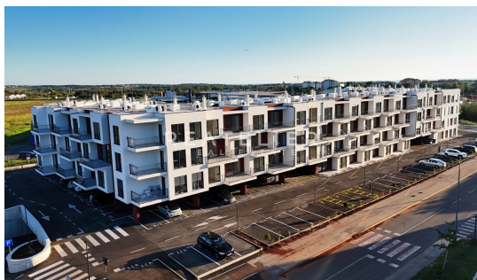
GARAŽA - garažna parkirna mjesta i spremišta